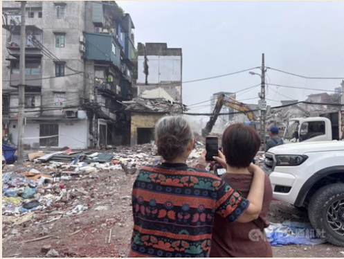
河內民眾圍觀公寓拆除工程。