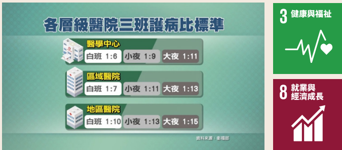
不同層級醫院的三班護病比標準。

立法院5月8日三讀通過《醫療法》修正草案，正式將「三班護病比」納入法律，預計於2028年5月1日實施。「三班護病比」是指醫院在白天、小夜班、大夜班這3個時段中，每位護理師最多可以照顧的病人數。以醫學中心為例，