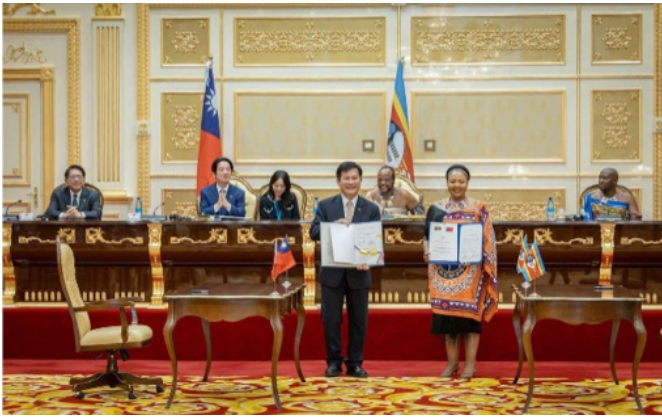
賴總統（後左 2）與史國國王（後右 2）見證兩國簽署關務互助協定。

賴清德總統 5 月 2 日順利飛抵我國非洲友邦史瓦帝尼，並與史國國王恩史瓦帝三世（King Mswati III）進行會談，共同見證兩國正式簽署關務互助協定。這份協定是延續