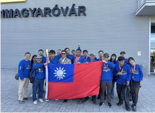
參與第 28 屆「莫雄堡模型大賽」的臺灣隊賽後合照。