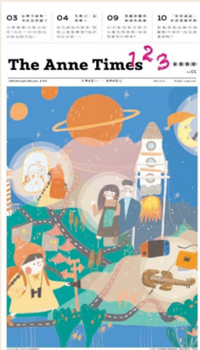
《安妮新聞 123》特刊— 「我與你與他」封面。