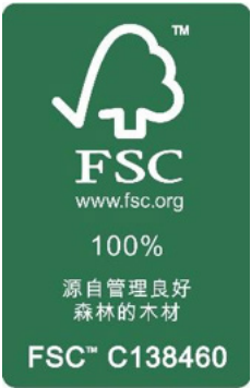
FSC 認證標章。

農業部林業及自然保育署（簡稱「林保署」）近年推動與原住民族一起管理山林，成果受到國際肯定。苗栗南庄的賽夏族林業合作社，在政府的輔導下，用傳統智慧加上現代科技，發展養蜂、生態旅遊和文化體驗，不僅保護森林、減少盜伐，也為部落增加了收入，近期更成為臺灣第 1 個「國際森林管理委員會」（FSC）的團體會員。林保署表示，臺灣目前有超過 7 成的森林通過 FSC 的環保永續經營認證，