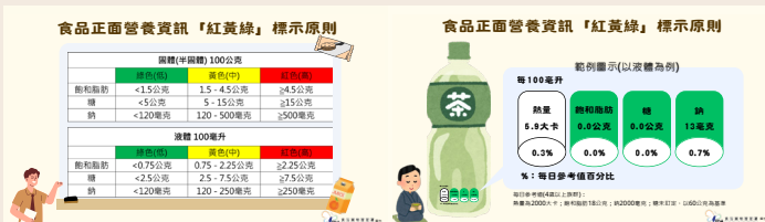
食品「紅黃綠」3 色分級營養標示說明圖與範例。

為了讓民眾更容易看懂食品的營養資訊並挑選健康的食品，衛福部 4 月 10 日宣布，計畫在 2026 下半年推出食品「紅黃綠」3 色分級營養標示。這個標示將針對食品中糖、鹽（鈉）、飽和脂肪這 3 種成分的含量分別做分類標示：標示綠色代表含量低、較健康；紅色表示含量高，應該少攝取；黃色則介於中間值。衛福部表示，臺灣有