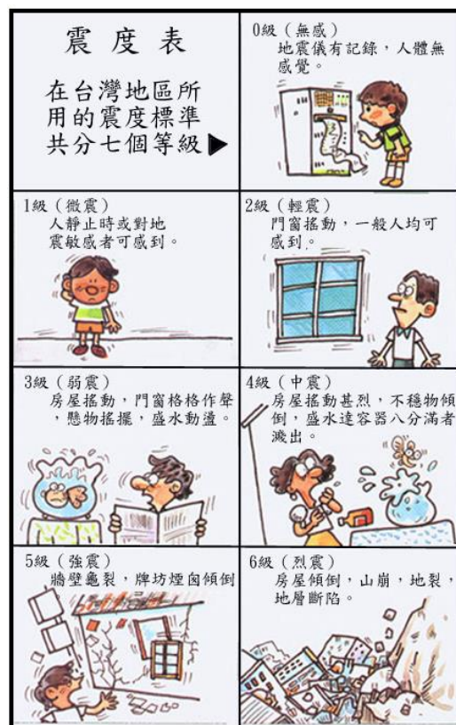
▲ 台灣地區所用的震度等級

舉例來說，台灣 921 大地震的規模 7.3，在台北震度為四級，但在震源上方的南投，震度卻高達七級，而離南投很近的台中，震度也達到六級，難怪這兩個地方會成為這次地震的重災區。