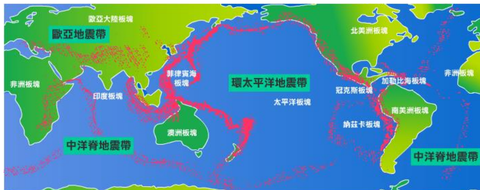
▲ 地球的板塊與地震帶

由於地球的板塊運動一直持續進行，彼此也一直不斷相互推擠、錯動，當板塊岩層再也無法承受這些力量（應力）時，岩層便會斷裂錯動，並釋放巨大的能量（地震波），所造成的地表震動，就是我們所感受的地震了。根據研究顯示，地球上所發生的地震，其中約 90% 都是由板塊運動引起的，這個結果也能用來說明，為何全世界最容易發生地震的區域「地震帶」，都是位於板塊交界處或板塊內部的斷裂帶上。