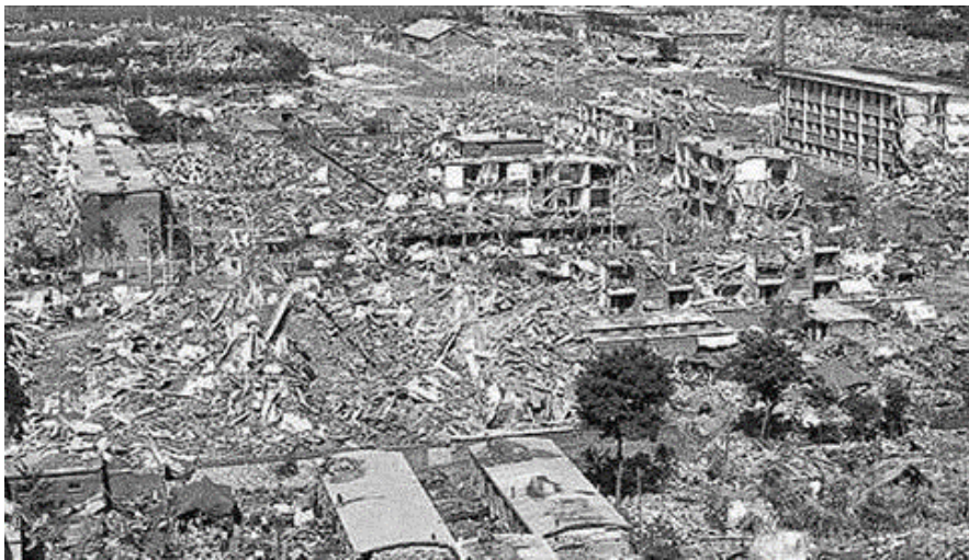
▲唐山大地震後的市區景象

對人類來說，最恐怖的天然災害就是地震了，沒有之一，而之所以恐怖，乃因它的不可預測與其破壞力。地震常常來的又急又快，一點徵兆都沒有，不像其他天災，如颱風、海嘯、火山爆發等，大難臨頭前還有跡可循，可以事先防範並降低損害。此外，地震的破壞力也難以評估，在強震下，毀滅只在瞬間，像 1976 年中國的唐山大地震，頃刻之間唐山市就被夷為平地，造成近 25 萬人罹難。