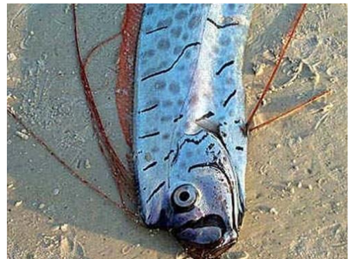
▲ 勒氏皇帶魚

大自然中像皇帶魚一樣能夠預測地震的動物，其實還不算少，如蚯蚓、蟾蜍、老鼠、海豚等，在地震前都曾出現異常行為。例如 2009 年義大利 拉大奎拉地震發生的前幾天，曾出現蟾蜍紛紛離開池塘的奇景；2011 年日本 311 大地震前也曾傳出海豚大量擱淺的現象。只不過，關於動物能夠預測地震的說法，因為缺乏有力的科學證據支持，在科學界仍是備受質疑，可說是「公說公有理，婆說婆有理」，到底真相如何，就靠未來的你發掘囉！